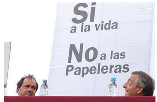
El presidente Kirchner y el vicepresidente Daniel Scioli, durante el acto de repudio realizado el 5 de mayo de 2006.

En conclusión, los parámetros ambientales resultantes de la operación de las plantas estarán dentro de los límites estrictos de normas ambientales. De acuerdo a ello no se esperan efectos adversos sobre la salud o la biodiversidad y no se generará contaminación sobre costas y territorio argentino. No obstante, La Academia Nacional de Ingeniería considera como una cuestión fundamental el monitoreo y control del cumplimiento estricto de las condiciones de diseño, durante la operación de las plantas.