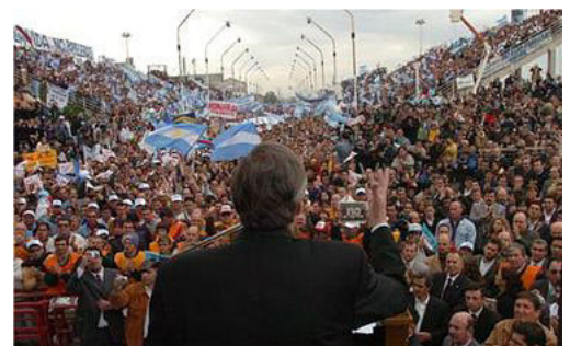
Manifestación opositora a las plantas de celulosa, realizada en Gualeguaychú el 5 de mayo de 2006.

El 11 de abril de 2006 la Corporación Financiera Internacional (Grupo Banco Mundial) publicó un informe de un panel de expertos independientes que examinaron