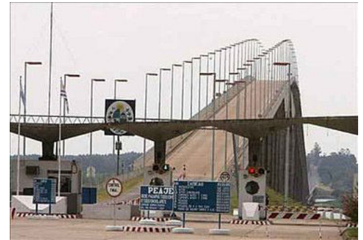
Marcha realizada el 29 de abril de 2007.

El 29 de abril los activistas de Gualaguaychú organizaron una marcha sobre el puente Gral. San Martín. Las estimaciones sobre la cantidad de personas fueron dispares. 53