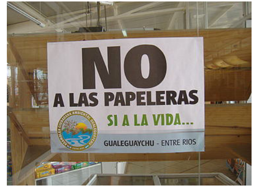
Cartel repudiando a las papeleras.

La plantación de eucaliptus y la instalación de plantas de pulpa de celulosa es una estrategia productiva que se está generalizando en Sudamérica : “las plantaciones de eucaliptos y pinos en Argentina, Brasil, Chile y Uruguay representan el 40 % de las 10 millones de ha de plantaciones de árboles de rápido crecimiento existentes en el mundo”. 4