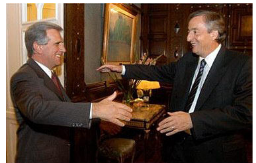
El 5 de mayo de 2005, los presidentes uruguayo y argentino acordaban crear una comisión para resolver el conflicto, que luego fracasaría.