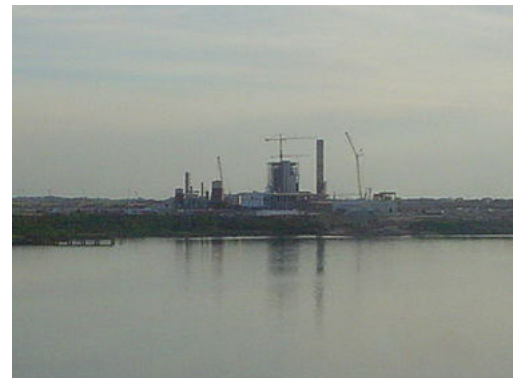
Planta de celulosa de Botnia en Fray Bentos (en obras, dic. 2006).