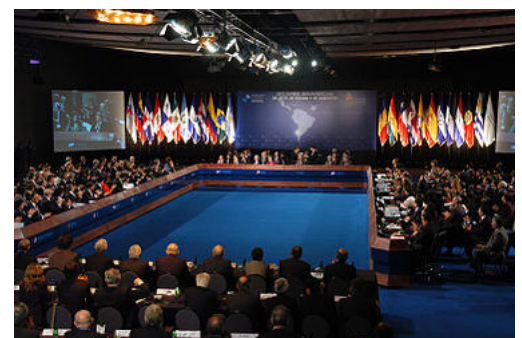
XVII Cumbre Iberoamericana, 9 de noviembre de 2007. Luego de no poder alcanzar un acuerdo en el más alto nivel, ambos países se recriminaron mutuamente y agradecieron la mediación del rey de España Juan Carlos I , presente en la cumbre.

El 1 de noviembre el ministro uruguayo Mariano Arana autorizó la puesta en funcionamiento de la planta de celulosa de Botnia, pero tres horas después la misma fue suspendida por el presidente Vázquez, a pedido del rey de España Juan Carlos I , con el fin de facilitar su mediación y un