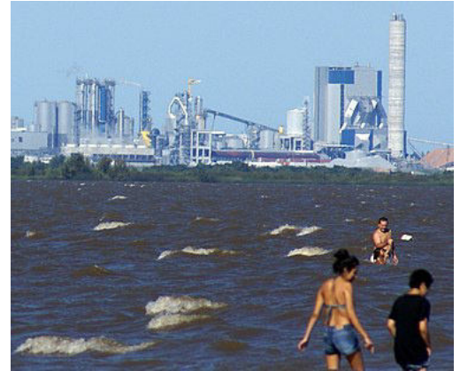
Planta de celulosa de Fray Bentos, Uruguay, vista desde la playa Ñandubaysal de Entre Ríos, Argentina.

Sergio Urribarri (Gobernador de Entre Ríos 2007 - 2015)