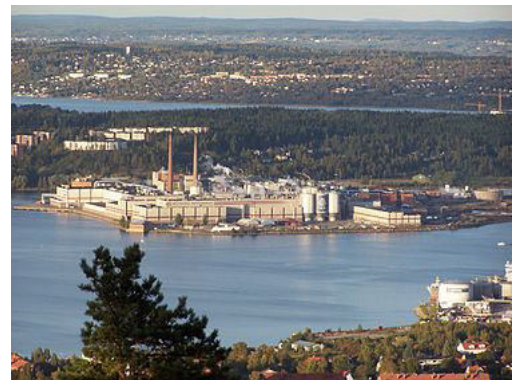
Planta de celulosa en Ortvikens, Suecia .

Durante las décadas de 1980 y 1990 Uruguay, con el apoyo del Banco Mundial , ha promovido y subsidiado fuertemente el desarrollo de la forestación con especies comerciales, principalmente pino y eucaliptus . Uruguay, una llanura con pocos árboles nativos (3 % de su territorio) ha creado,