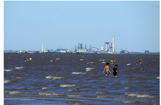
Planta de celulosa de Botnia sobre el río Uruguay, visto desde la playa Ñandubaysal en la costa argentina.

Mientras tanto el día 29 de abril se sucedió una reunión bilateral entre los presidentes de Argentina y Uruguay para tratar de destrabar el conflicto a nivel del bloqueo de la ruta que une a ambos países. Luego de la reunión los presidentes brindaron una conferencia de prensa en la anunciaron "un proceso de reencauzamiento definitivo entre ambos países", esquivaron tratar el tema del corte que mantienen los assembleístas como símbolo de su lucha contra la ex Botnia (hoy UPM). Dicha reunión fue considerada "lastimosa" por los ambientalistas, por no haberse considerado el tema del bloqueo de la ruta y confirmaron que continuarán con "el plan de lucha" en tanto no se "erradique la pastera". 73